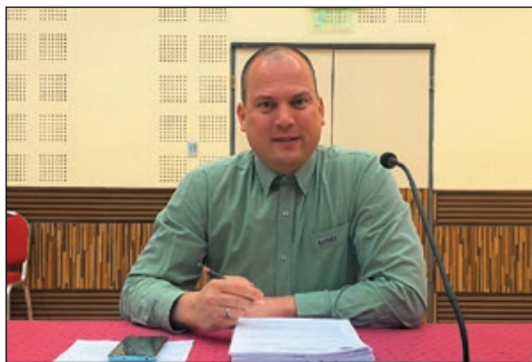
A képviselő naplója