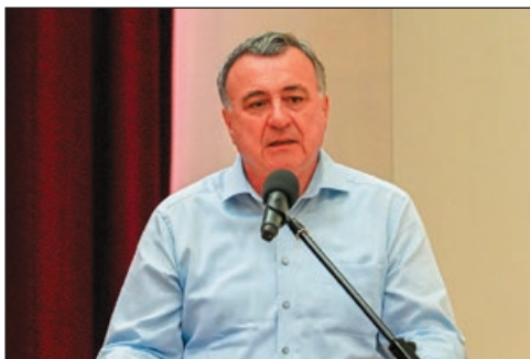
Öt kérdés 5 percben