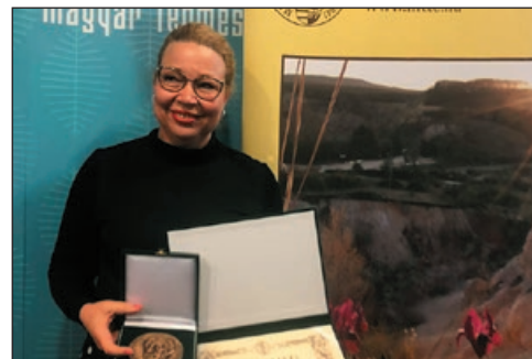
Egy pedagógus valódi mércéje