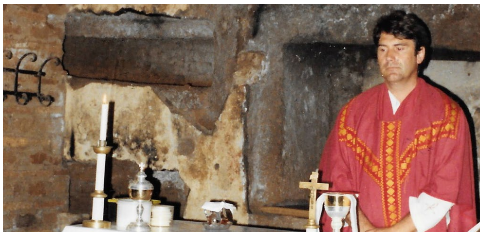
Római katakombákban (1988. május)

A kicsi, barátságos szobában nevetve mutatta be a „dolgozószobát” egy laptoppal felszerelt íróasztalt, a „könyvtárszobáját”, vagyis egy könyvespolcot, a „hálószobát, vagyis az ágyat, ahol pihenni, aludni szokott, és a mosdót, ahol a kézmosást, reggeli mosdást is el tudja végezni. Ez a kicsi világ az ő mostani otthona és még egy aprócska szoba, ahol személyes ereklyéit, egy értékes munkával eltöltött élet kitüntetéseit, okleveleit őrzi a falakon.