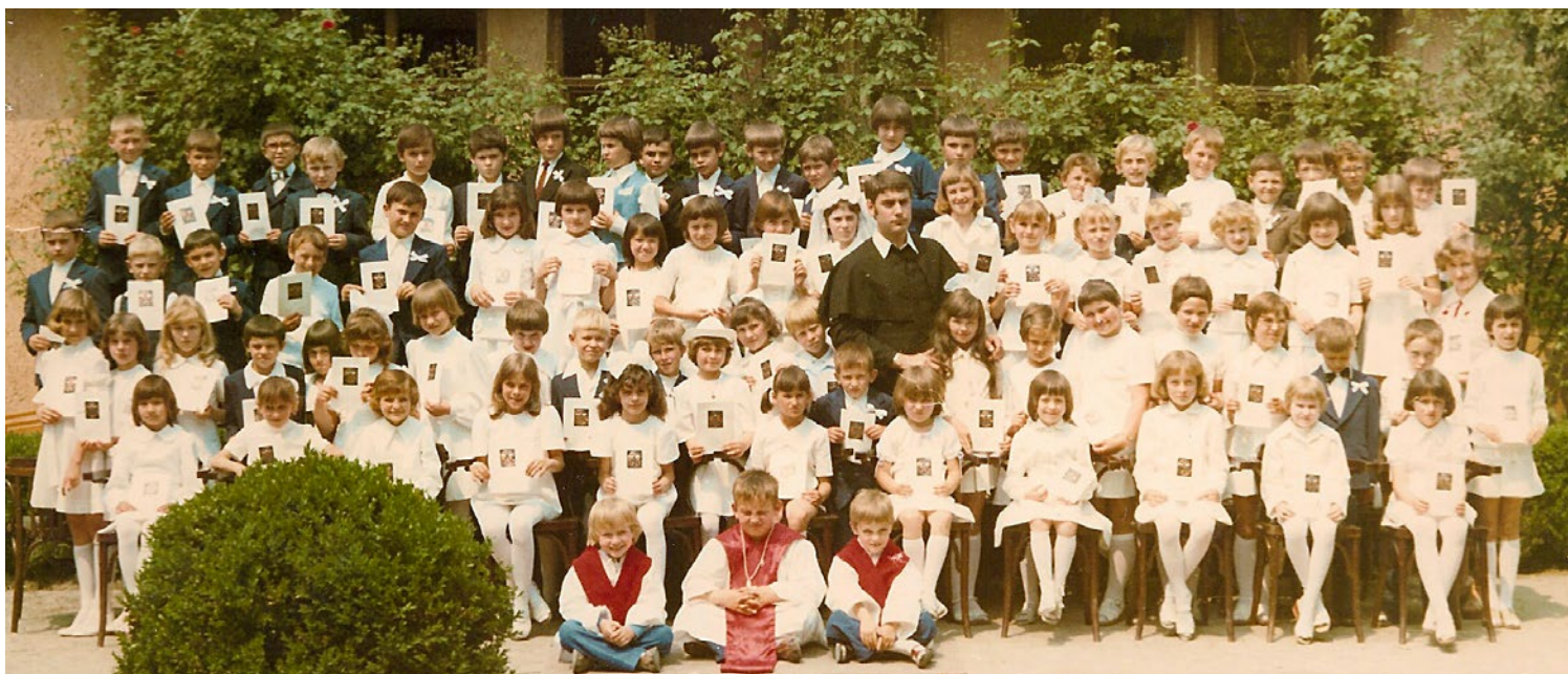
Elősáldozás Tiszakécskén (1978. május)

Az első probléma, nem ismerjük eléggé a vallást, a kereszténységet. Megismerni és utána megszeretni Jézust, nem misztifikálva, a nyakába borulva, mintha jó barátom lenne, az távol áll tőlem. Mégis, annyi jót megtudni róla, hogy automatikus szeretet fakadjon iránta, akkor sokkal könnyebb komolyan venni mit kér? Mit kell teljesítenem? Nem a magam életében mondom, hanem az emberek rám bízottak életében. Megismertetni velük, megszerettetni velük Jézust, ehhez például nagyon jól jön a humorom. Mert sokkal inkább vevők az emberek a tanításra, ha van benne „egy kis könnyű műfaj”.