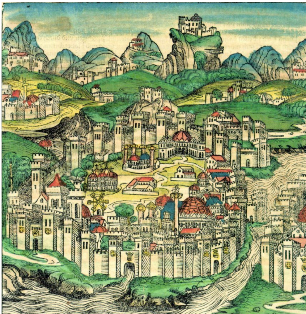
Konstantinápoly (Nürnbergi Krónika, 1493)

Az Egyháznak nem volt módja alkotóan továbbfejleszteni a bizánci keresztény kultúrát. Két ellentétes tendencia figyelhető meg. Egyfelől rendkívül szigorú konzervativizmus, másfelől kritikátlan elnyugatiasodás. Okai: mivel nem tudta továbbfejleszteni, igyekezett minél jobban konzerválni. Másrészt mivel nem volt lehetőség az orthodox teológia kibontakoztatására,