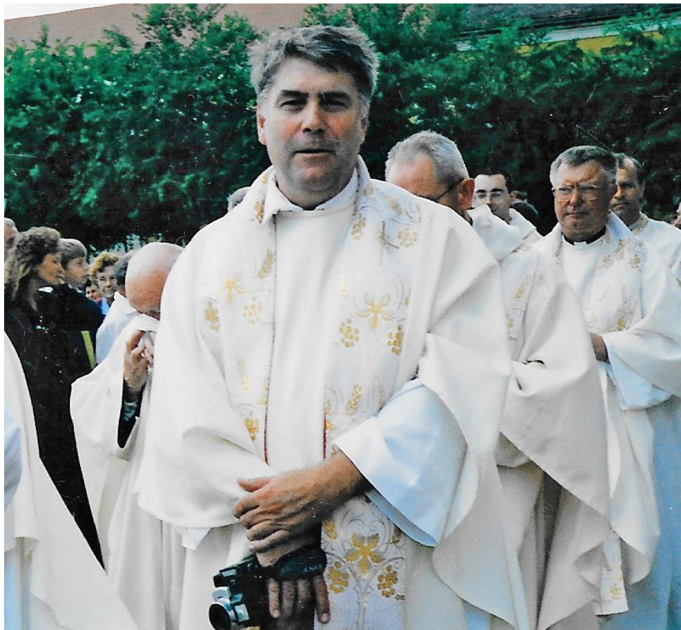
Lourdes – bevonulás 300 pappal (1990-es évek)

Sok ilyen élményem volt, kerékpártúrától kezdve minden, ami belefér egy átlagos ember életébe. Szóval így alakult.