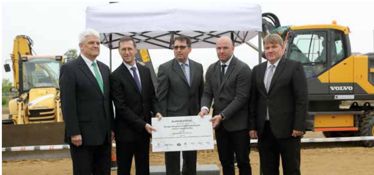
Az M4-es gyorsforgalmi út új szakasza mintegy 30 kilométeren át új nyomvonalon halad

Az M4-es gyorsforgalmi út 44,4 kilométeres szakasszal bővül, a beruházás összértéke több mint 72 milliárd forint. 2019 őszére két ütemben, Üllő és Albertirsa, valamint Albertirsa és Cegléd között épül meg az új kétszer kétsávos gyorsforgalmi út.