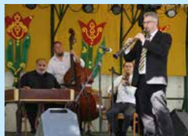
Tavaly nagy sikert aratott a fesztivál