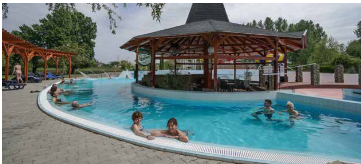
A ráckevei termál- és élményfürdő folyamatosan fogadja a látogatókat

Közéleti havilap | www.pestmegyelapja.hu