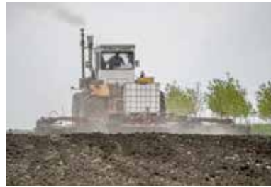
Mindenütt esedékes a gépek, a traktorok cseréje

– Kozma László: Nem az informatikai eszközök igazán drágák, hanem a GPS-szel és más műszerekkel felszerelt modern mezőgazdasági gépek, valamint