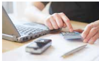
Ne felejtjük el ellenőrizni a bevallást

Aki adótervezését rendezné, erre már online is van lehetősége, nem csak személyesen a NAV ügyfélszolgálatán. Ha a fizetendő személyi jövedelemadó és egészségügyi hozzájárulás összesen nem haladja meg a 200 000 forintot, legfeljebb havi, egyenlő részletekre osztott részletfizetést is kérhet a bevallás erre vonatkozó pontjának kitöltésével. Az első részlet befizeté-