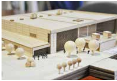
A beruházás makettje

A beruházás új lehetőséget nyit a település lakosságának, hiszen a többfunkciós, korszerű épületet a sportolás és a sportrendezvények mellett az iskolások tornateremként tudják használni, a fedett csarnok kiváló helyszínt nyújt különböző rendezvényeknek.