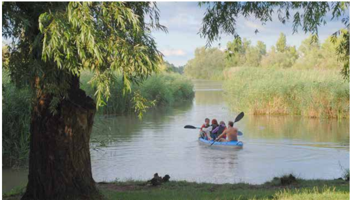
A soroksári-ráckevei Duna-ág a természetjárók, kikapcsolódásra vágyók kedvelt célpontja

– Mint korábban már említettem, az MO-ás körgyűrű közelségének köszönhetően sok vállalkozás talált otthonra ipari parkjainkban, s a lakosság szám