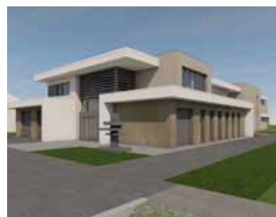
Az új alapellátási központ hosszú távra megoldaná Vecsés város lakosságának egészségügyi ellátását

Az építési munkálatok várhatóan a következő év elején kezdődnek meg, jelenleg az épület tervének engedélyeztetése zajlik. (x)