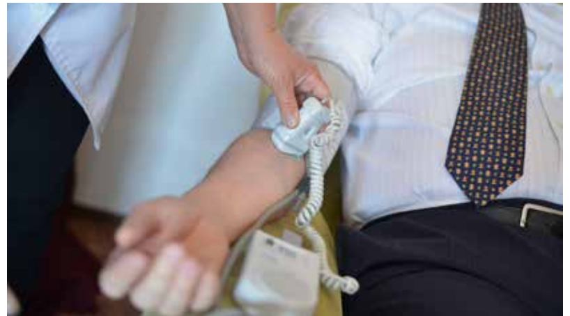
Az új intézmény a jelenleginél gazdaságosabban működik majd

Az új épület korszerű és integrált járóbeteg-ellátást tesz majd lehetővé, hiszen a tervek szerint a kórház fekvőbeteg osztályainak járóbeteg-ambulanciái is az új épületbe költöznek, tehermentesítve ezzel a kórházi osztályokat. A remények szerint a fekvő- és járóbeteg-ellátás szétválasztása tovább csökkenti a kórházi fertőzések számát is. Egyszerűbbé válik a betegirányítás és az elő-