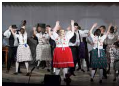
A január 21-i névadó ünnepségen az Ofella Sándor Hagyományörző Népi Együttes

– Május 12-én harmadik alkalommal ünnepeltük a falu születésnapját. Három