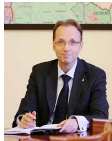
Pest megye kormány megbízottja tájékoztatót a lehetőségről

A pályázatokat személyesen (1117 Budapest, Karinty Frigyes út 3.), illetve postai úton lehet benyújtani a borítékon „SK” jellel ellátva a Pest Megyei Kormányhivatal Hatósági Főosztály Munkaerőpiaci Osztályához