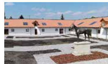
Kincsem egykori istállója a Pest megyei értéktár része

A magyar lósport büszkesége, a legyőzhetetlen „csodakanca” egykori istállója ugyan helyi védetség alatt állt, ám a romos épület az utóbbi évtizedekben kihasználatlan maradt. Az elmúlt év során Göd város önkormányzata pályázati forrásból felújította az épületegyüttest. A nagyszabású beruházásnak köszönhetően egy kulturális és közösségi funkciókra alkalmas komplexum jött létre, amelyben a Kincsem pályafutását bemutató emlékszoba mellett kialakítottak egy többfunkciós, hangversenyek és kiállítások rendezésére egyaránt alkalmas termet is. Az épületben helyet kap egy, a helyi mesterségeket bemutató házi múzeum, valamint a kerékpáros turizmust kiszolgáló „bringapont” és egy kávézó. ❖